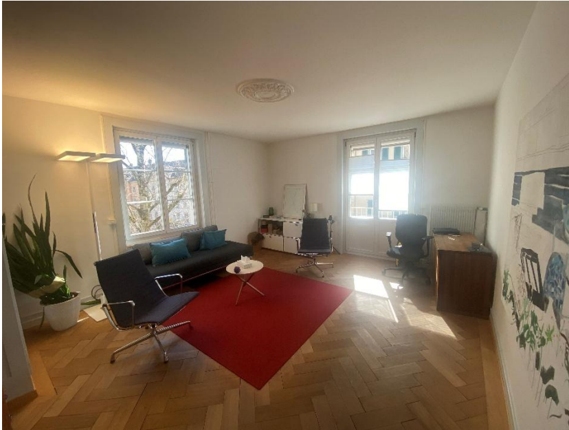
Praxisraum 2. Stock

Sie arbeiten auf eigene Rechnung und sind nicht formell angestellt. Zugleich sind Sie Teil der Praxisgemeinschaft von Sollievo.net. Als Mitglied von Sollievo.net nehmen Sie regelmässig an Teamsitzungen und Teamaktivitäten teil.